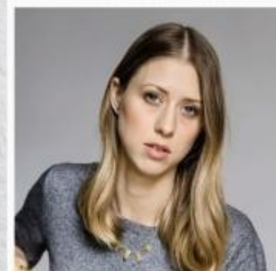
Gründerin und Dozentin

lebt ihre Überzeugung eines nachhaltigen Lebens, sowohl beruflich als auch privat. In Ihrem Buch " " zeigt sie auf stilvolle Art, wie beglückend und genussvoll nachhaltiges Leben aussehen kann.