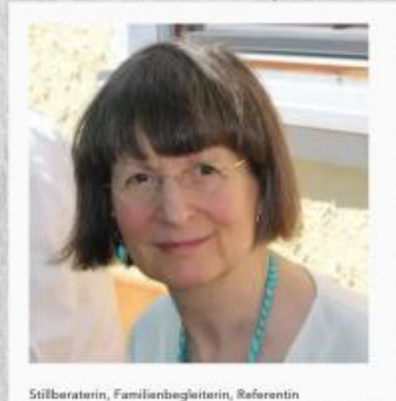
Stilberaterin, Familienbegleiterin, Referentin