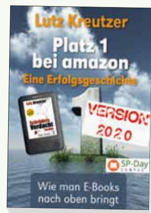
Kindle-Ausgabe, aktualisiert 2020 ASIN: B00CGMV0S6